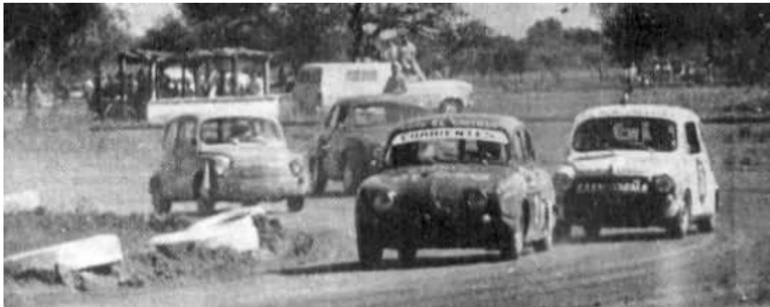
Cabrizas y Capitanich en dura lucha