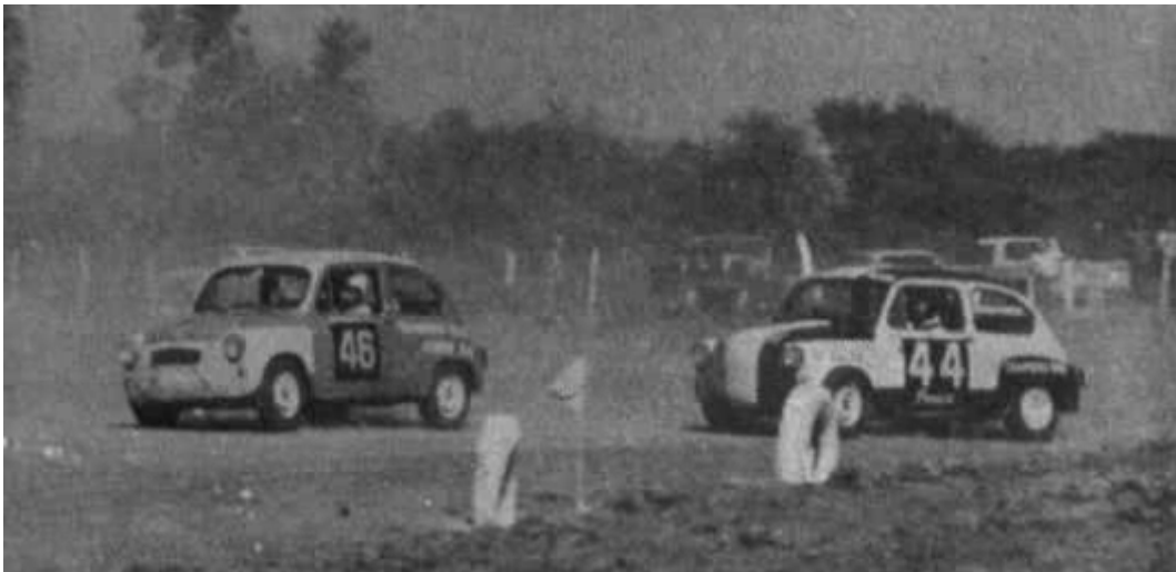
Rebaudino y Falcó