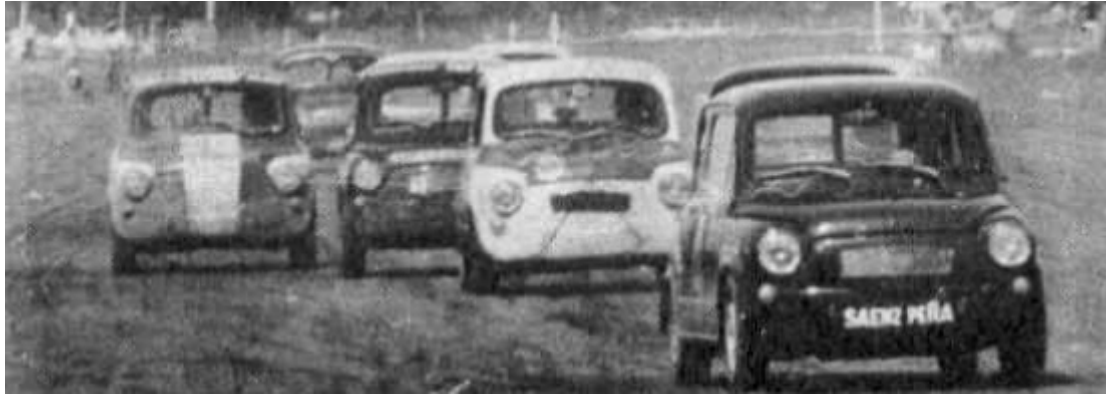
Capitanich encabezando éste pelotón