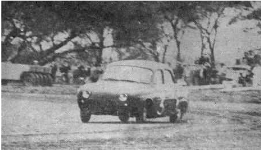
Oscar Cabrizas en derrape controlado