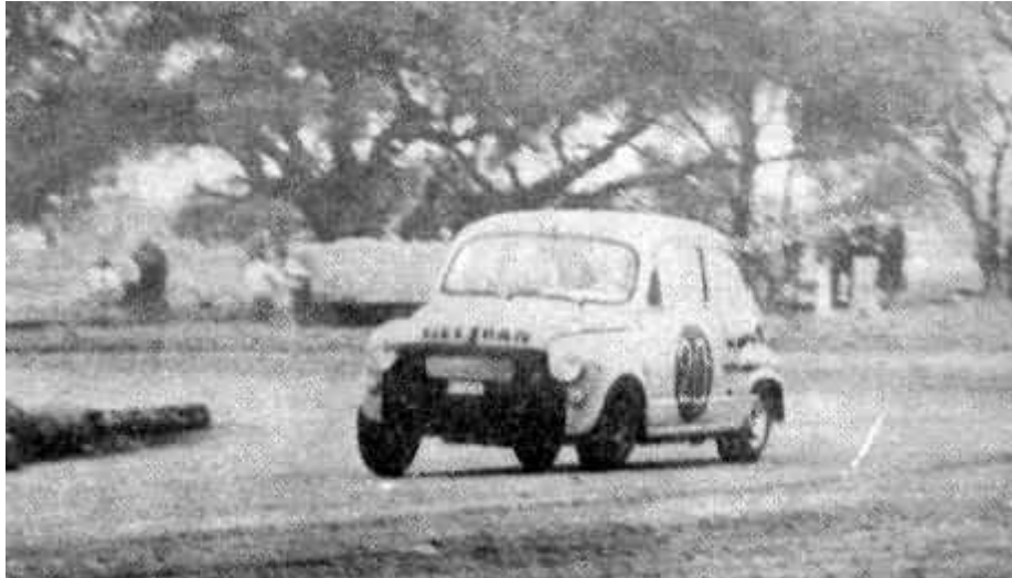
Julio César Cossani y su Fiat 600 color té con leche