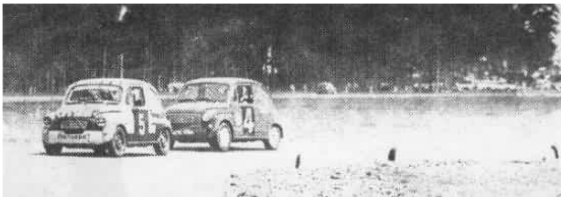
Ahora Cossani - Capitanich