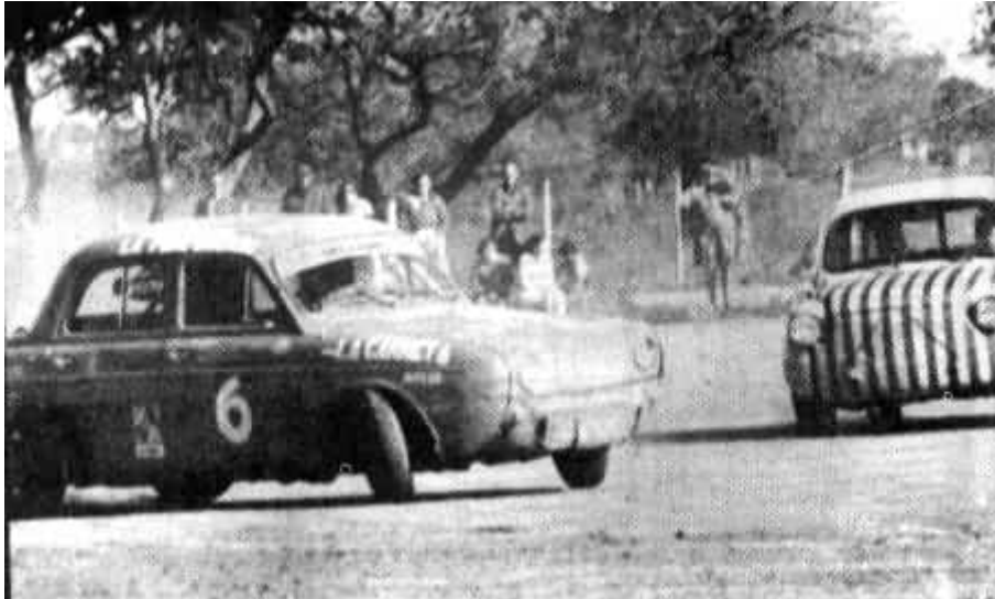
Franchi complicado y Hissgen aprovecha