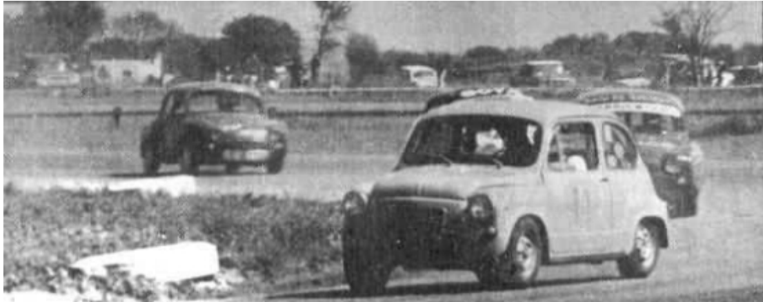
El "Polaco" Zsimansky