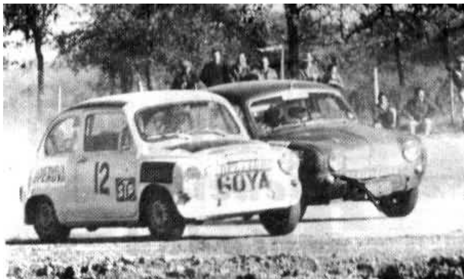
Pajares y Vollman en áspera lucha