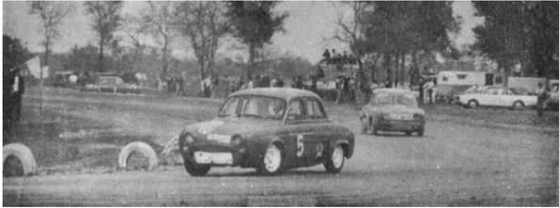
Inocente seguido por Franchi