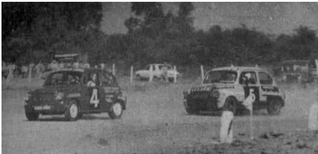
El duelo repetido: Capitanich - Cossani

Ganó Capitanich, seguido de Zsimansky y Falcó. Cossani venía ganando y debió abandonar faltando 3 vueltas.