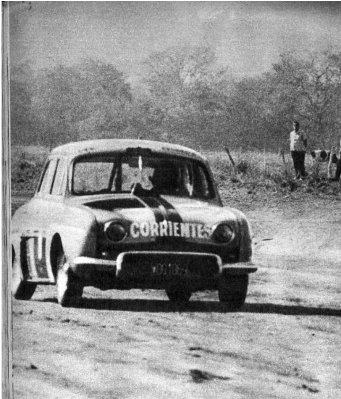
El Renault de Vicente Moncada