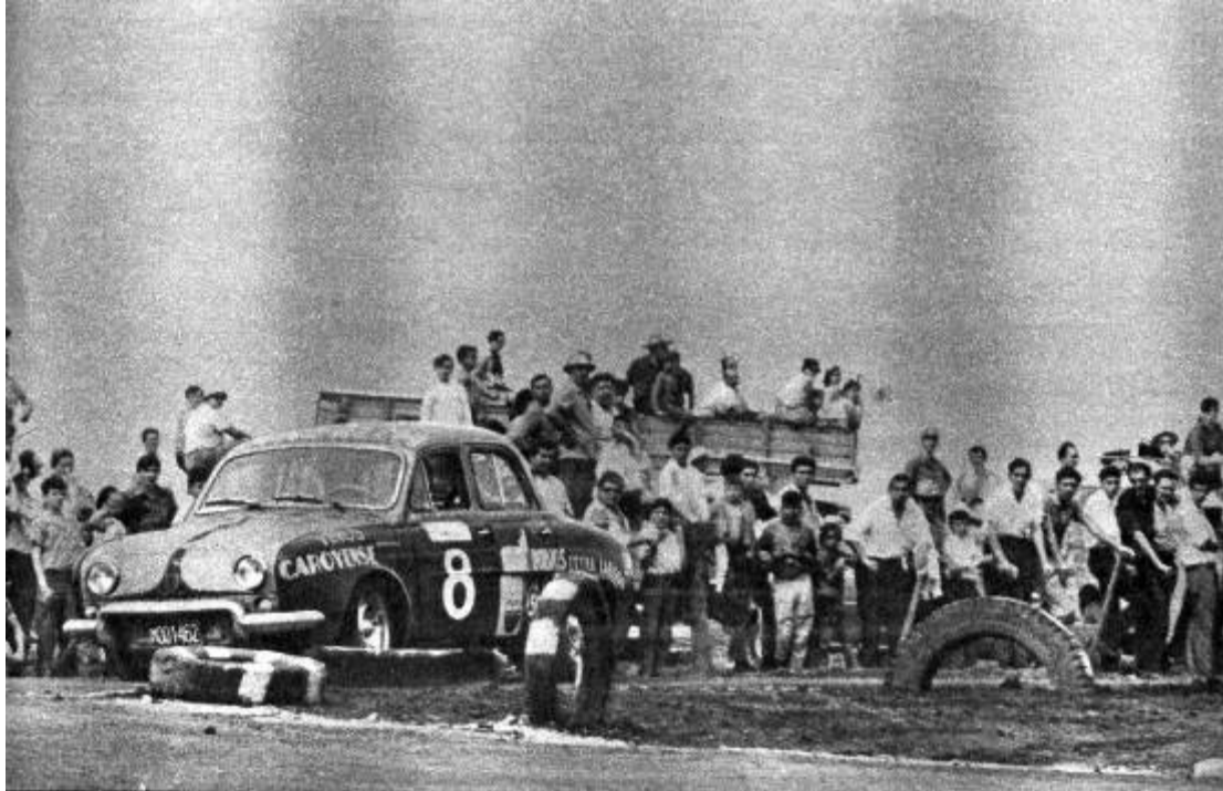
El chaqueño Héctor Rendón